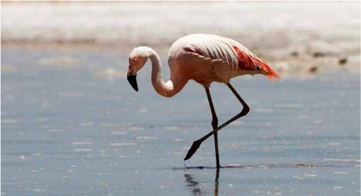
"Flamenco Chileno", chilensk flamingo. Här finns ibland en tredje flamingoart, som heter Flamenco de James, men den lyckades jag inte se.