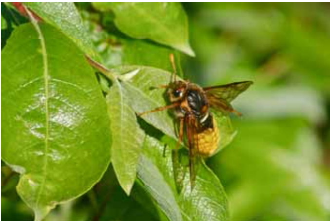
Cimbex femoratus. Stor klubbhornsstekel. Norr Norderåsen, bäck. Rapporterad