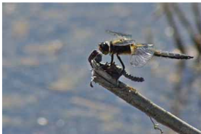
Fyrfläckad trollslända . Hane Rannåstjärnen.