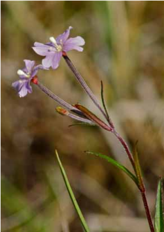
Kärrdunört Epilobium palustre L. Rannåstjärn. Rapporterad