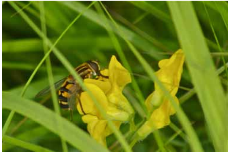
Större Kärrblomfluga Mot Dagsådalen. Rapporterad