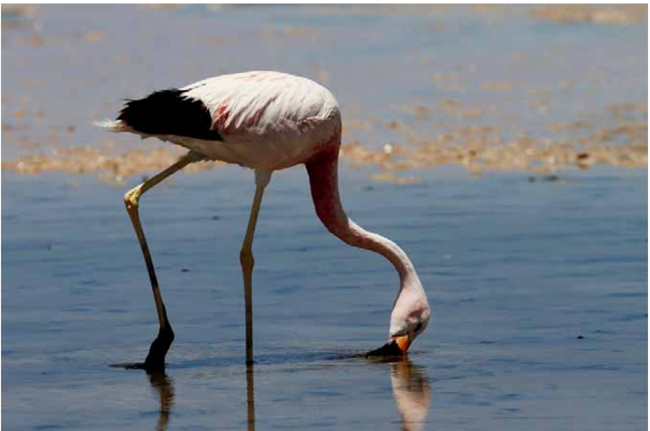
"Flamenco Andino", andisk flamingo eller flamingo från Anderna.