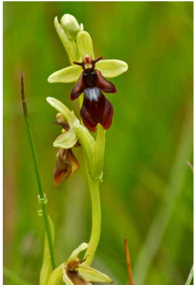
Flugblomster Hegled. Rapporterad.

Flugblomstret hade jag både sett och fotat tidigare år, men håll med om att vid första anblicken tror man att det är en sorts insekt man betraktar. Men när jag fotade den stora "flugan/bromsen" med de konstiga antennerna, hade jag ingen aning. Det visade sig vara en "Stor klubbhornsstekel" En annan gång upptäckte jag en blomma som var totalt okänd för mig. Den bara stod där och visade upp sina långsmala blommor i en lila/rosa/vit färgblandning. Efter mycket sökande och hjälp från Artportalen, konstaterades det att det var en Kärrdunört Epilobium palustre L. Bivargen hade jag bara hört talas om men inte sett eller fotat förrän nu.