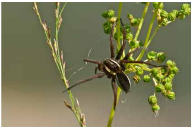
Dolomedes fimbriatus – Kärrspindel. Rapporterad.

Som fotograf ute i naturen stöter man ofta på nya upplevelser och intryck. Det kan vara insekter, växter eller situationer som är helt nya för en. För min del blev det även i år att jag drogs till fjärilarna. Under dessa fototurer upptäckte jag både insekter och växter som jag inte stött på tidigare. Jag började fota även dessa och läste mig till vad de hette och så vidare. Genom mitt fjärilsintresse hade jag kommit i kontakt med Artportalen på nätet, där man kan rapportera sina fynd. Jag anmälde mig som rapportör och har under mitt första rapportår, skickat in ett 40-tal observationer. Det har varit väldigt intressant och lärorikt. Här kommer några exempel på vad jag rapporterat förutom fjärilar.