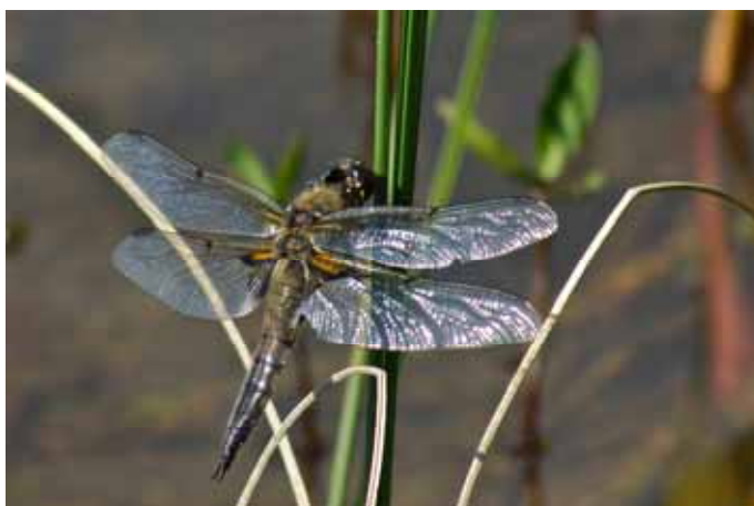
Fyrfläckad trollslända . Hane Rannåstjärnen. Rapporterad