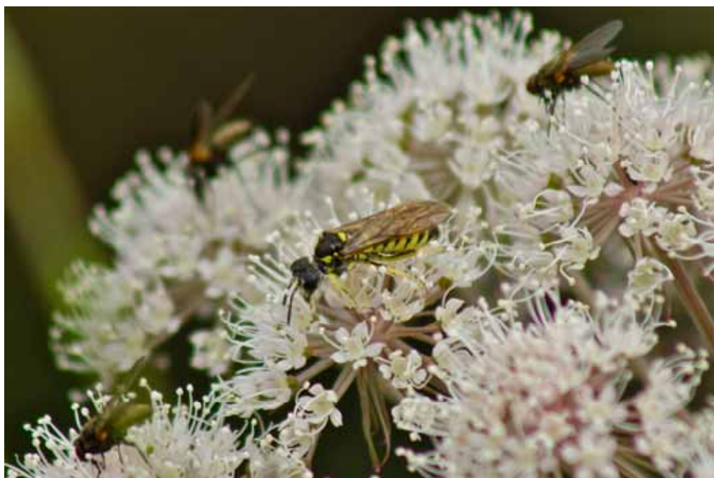
Bivarg Mot Dagsådalen . Rapporterad