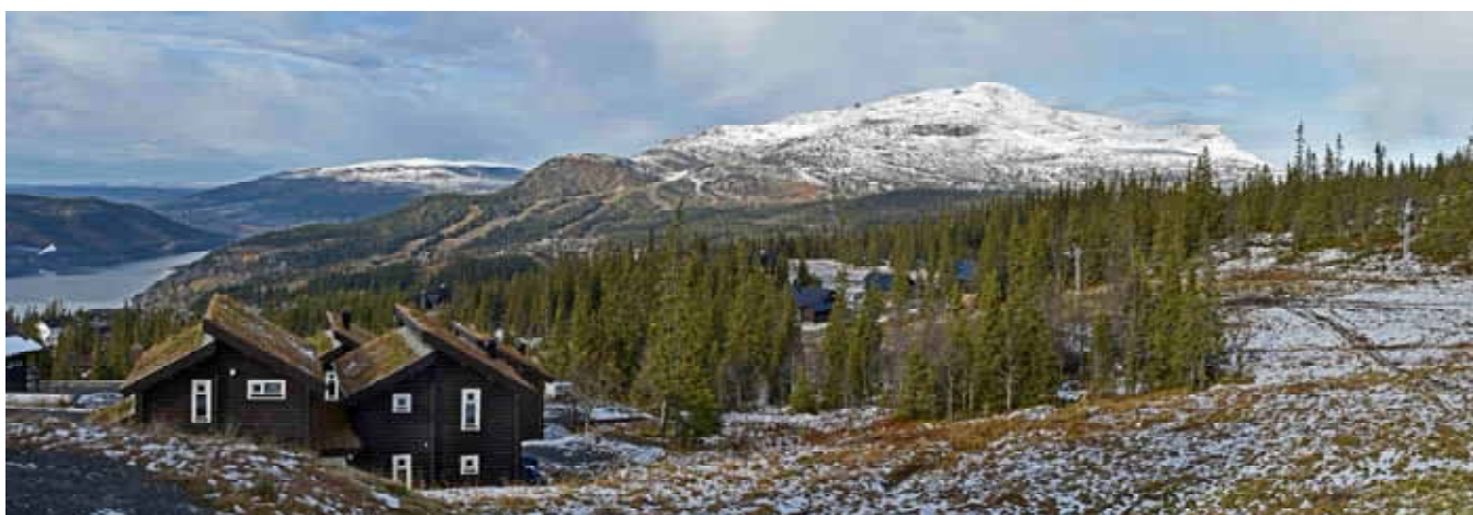
Åreskutan från Copperhill