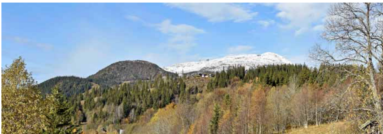
Skutan med snö på toppen