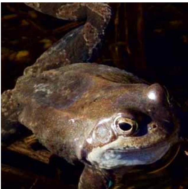
Vanlig groda med sitt karaktäristiska öga. Ser förmodligen lika bra under som över vattnet