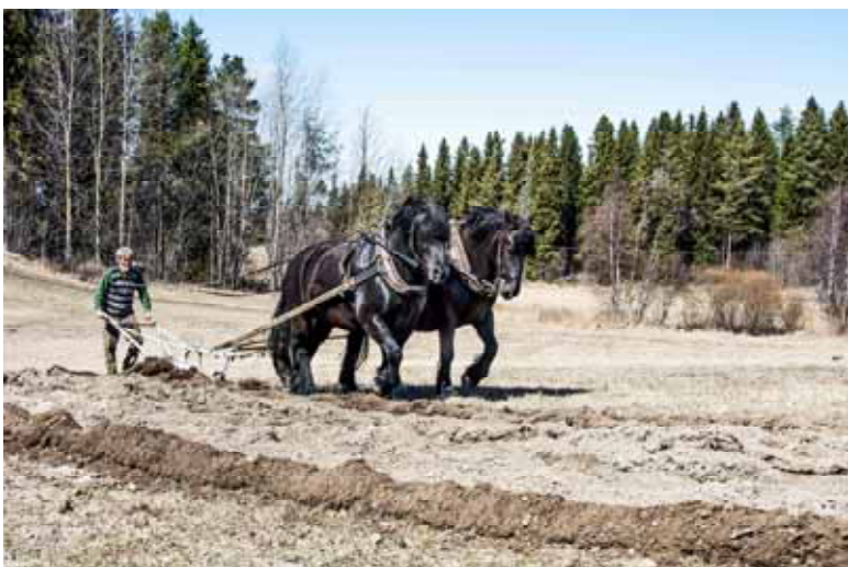
Vårplöjning 13 maj 2017