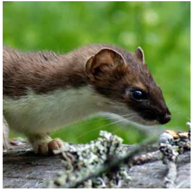
Hermelin med sin kolsvarta blick