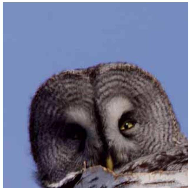
Här har vi verkligen en uttrycksfull blick. Nästan mänsklig blick av en Lappuggla