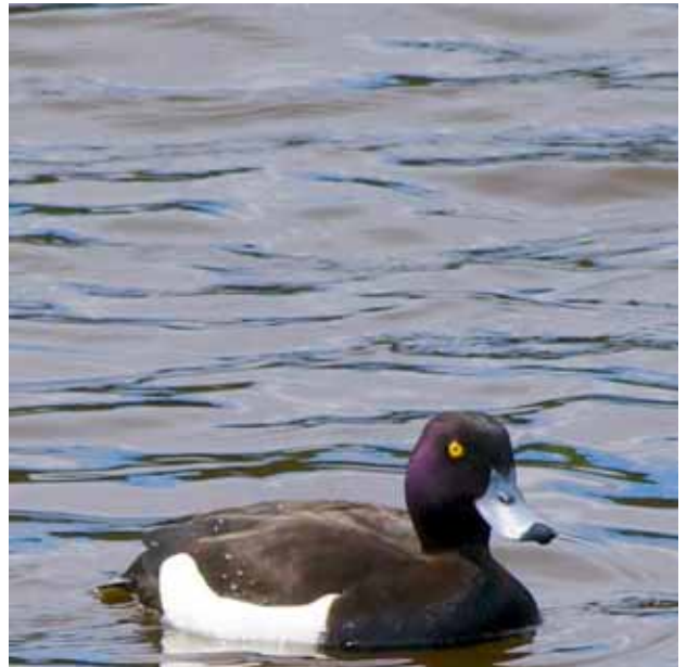
Viggen med sitt knallgula öga med svart pupill