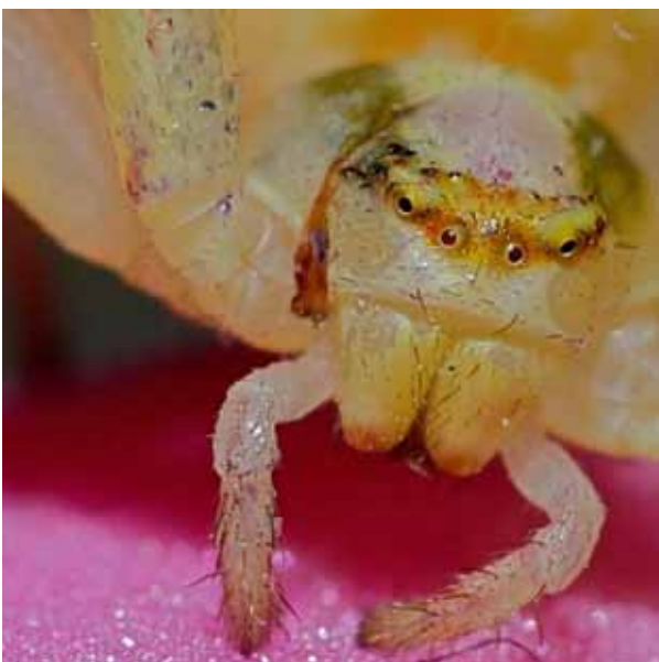
Blomkrabbspindeln nöjer sig inte med två ögon. Här ska det vara åtta. Olika färg beroende på hur ljuset faller in