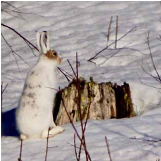
Hare med en markant ring runt ögat

Detta för att kunna jämföra. Vid en snabb titt på ett foto, kan ögonen se ut som just ögon. Men vid närmare granskning kan de vara väldigt olika.