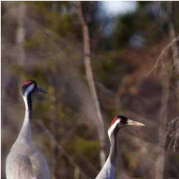
Tranans orangeröda öga med den kolsvarta pupillen