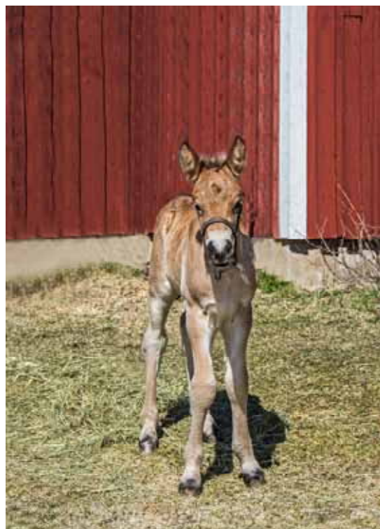
Hedas föl fem dagar gammalt