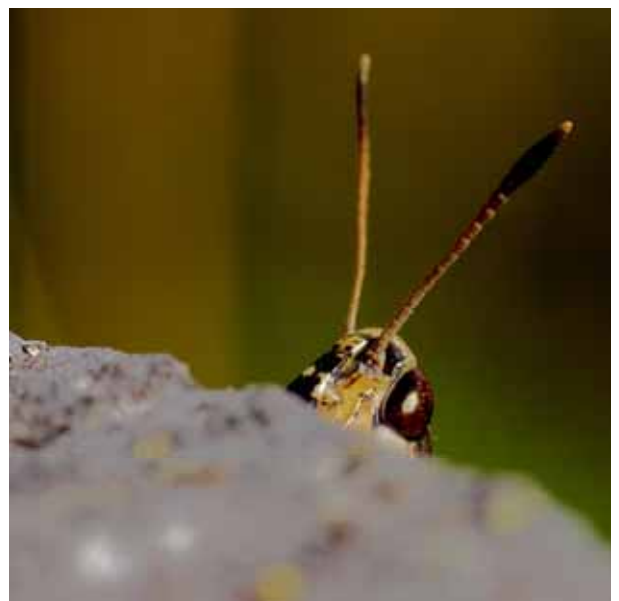
Skogsgräshoppan med sina stora brunfärgade och nötformade ögon