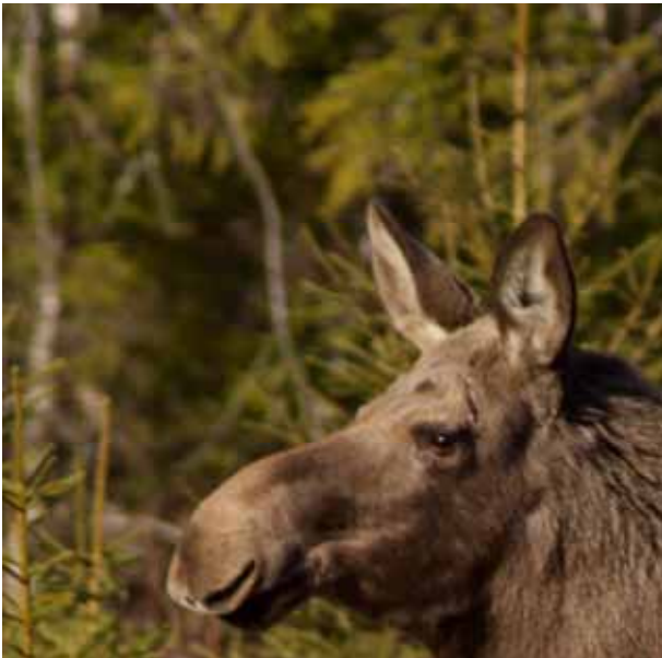
Älgkon ser nästan rödgråten ut med den rosa underdelen. Ögat mandelformat