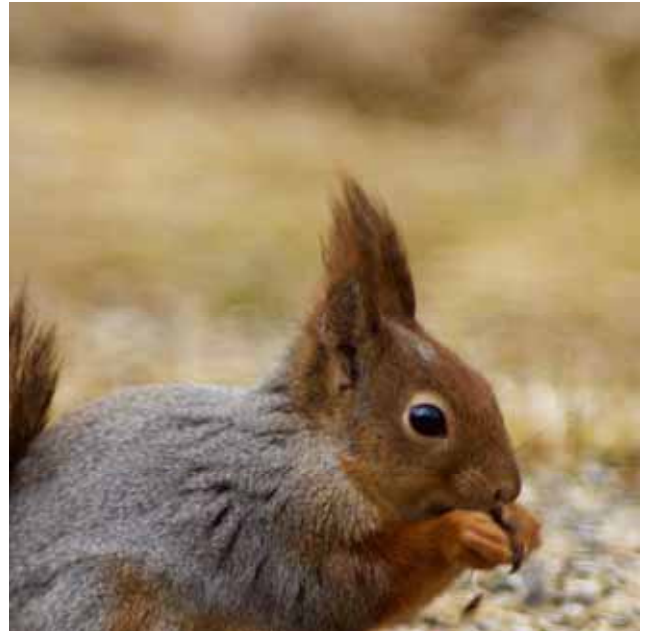
Ekorren har ett nästan päronformat svart öga