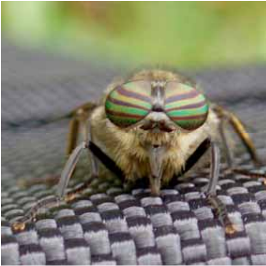
Bromsen med sina fasettögon ger nästan ett coolt intryck