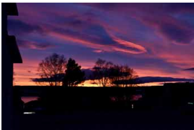
Ett minne från vintern med en magisk himmel på kvällen.