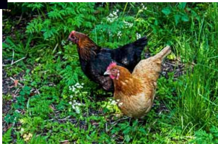
Two women working hard so we could get eggs for Easter.