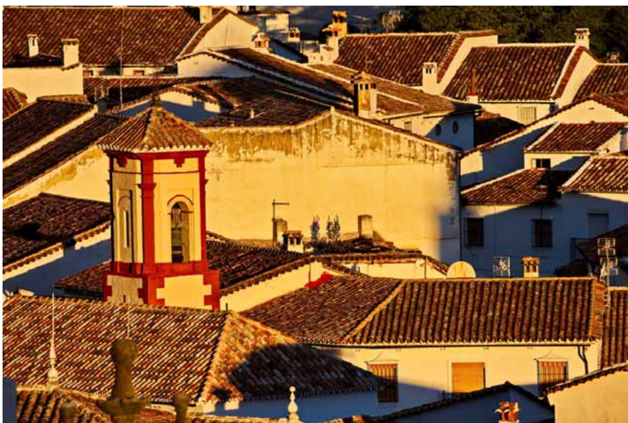
Här har de allra första solstrålarna börjat att nå ner till husen i byn.