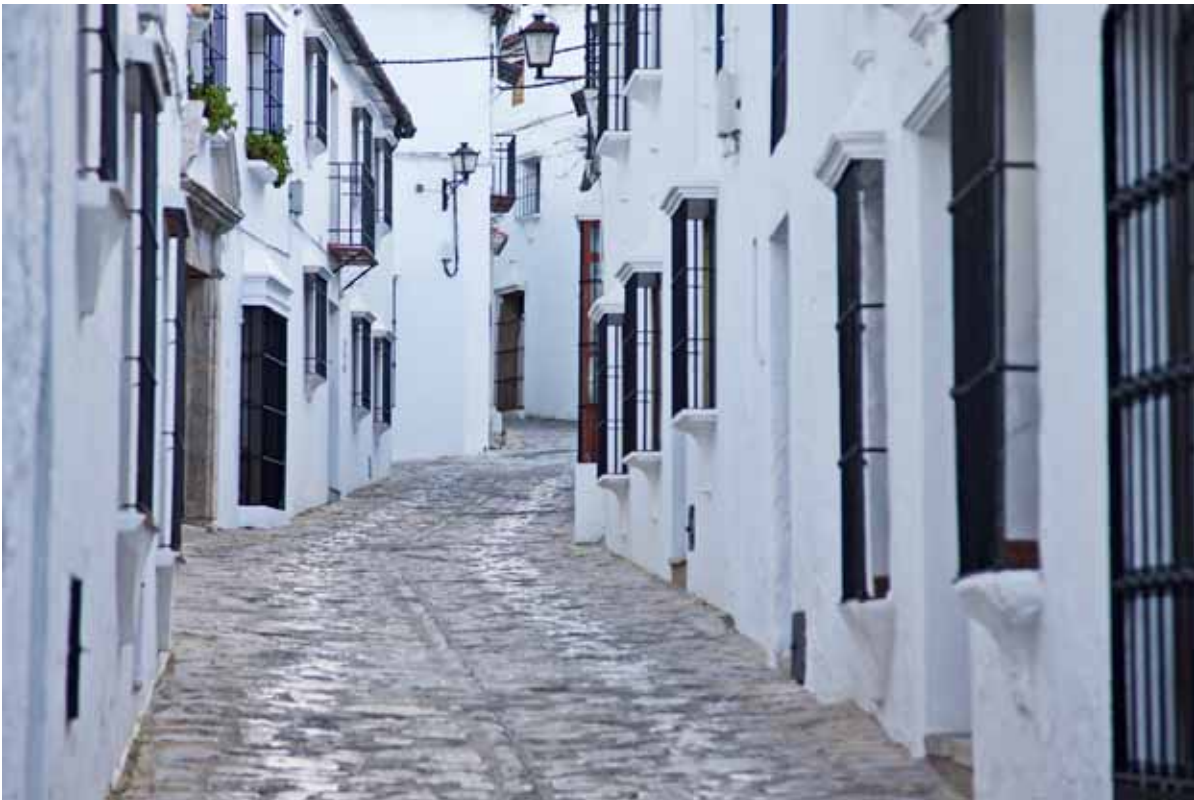
Innan mörkret kom gjorde vi en tur till fots inne bland gränderna.