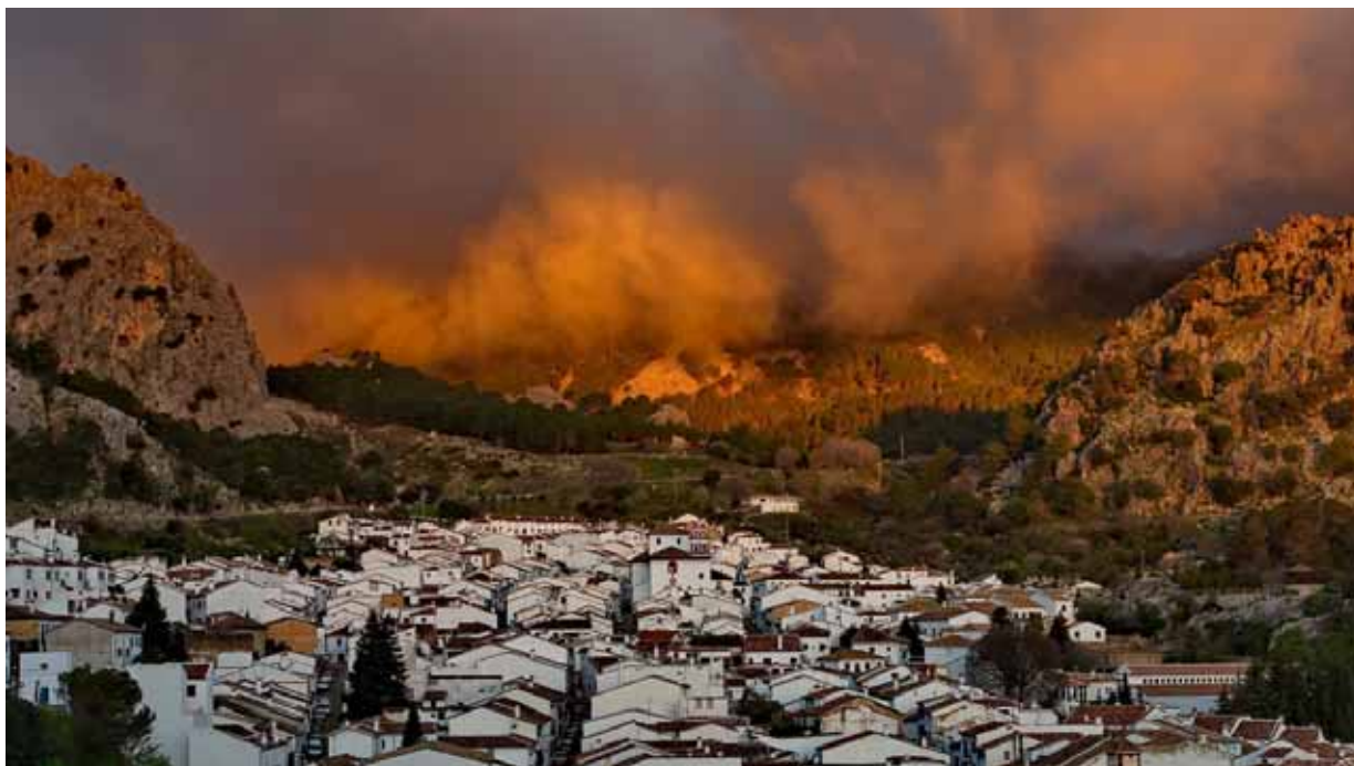
De första solstrålarna som kommer in över byn når endast till molnen.

Jag tänkte att det måste kunna bli skapliga bilder på alla röda tegeltak om jag var på plats före soluppgången nästa morgon. Sagt och gjort. Det var ju inte så svårt för soluppgången är ju inte särskilt tidig nu i mars. På morgonen var jag på plats och jag gick upp längs landsvägen från vilken man ser byn uppifrån. Det var fullständigt SVINKALLT. Det blåste en ganska hård nordlig vind och temperaturen var bara ett par grader över noll. Att mitt i allt byta objektiv gjorde att fingrarna blev lite stela. Det var lite mulet så jag tänkte att det kanske var onödigt och stå där och frysa, men plötsligt kom solen fram under några minuter och då gällde det att vara snabb.