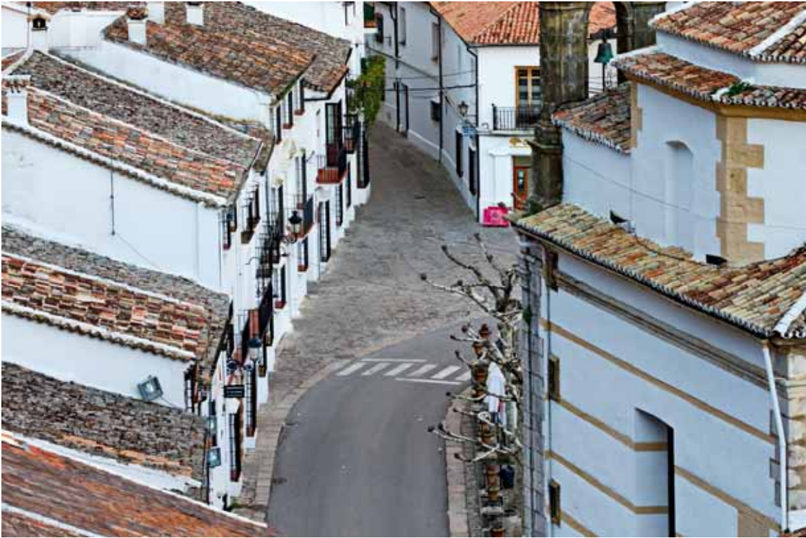
En liten del av byn sedd från landsvägen, som går längs en bergssida högt ovanför byn.