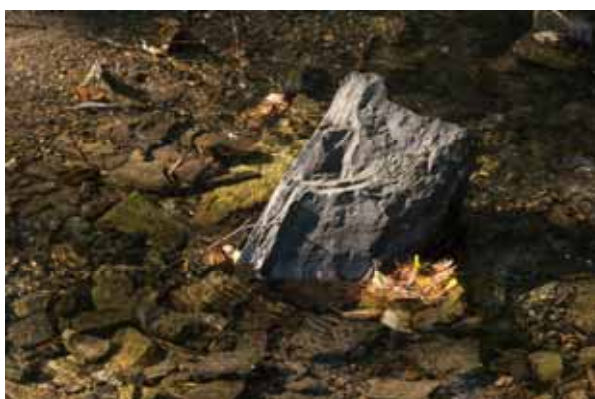
Anarisvägen - Lillsjön t.o.r. 10/9, kl 11.17-12.18.