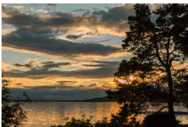
Minnesgärdet den 30/8 efter samlingen på ABF, kl 19.50-20.17.