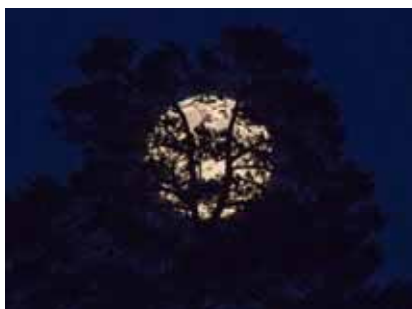
fullmåne från badrumsfönstret hemma på Anarisvägen den 29/8, kl 20.52.

Lennart Åkerblom har varit ute på camwalk. Bilderna är tagna i raw med Canon 70D+objektiv 17-85 och sedan redigerade i Lightroom 5 och sparade i jpg.