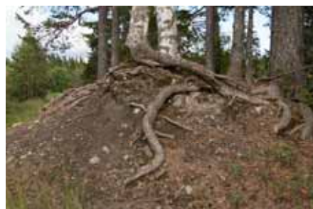
camwalk från Anarisvägen till Furuparken 31/8, kl 16.32-16.46.