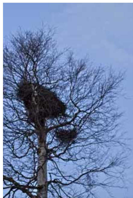
Skatbo i tre våningar räcker inte till. Nu bygger mästerbyggarna även ut med en altan.