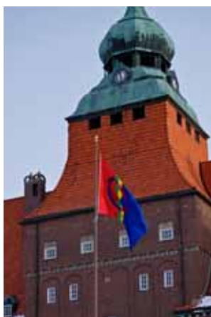
Sameflaggan hissad framför Rådhuset.

Så passerade jag vårt vackra Rådhus och där flaggades det med den samiska flaggan, också den mycket mycket vacker.