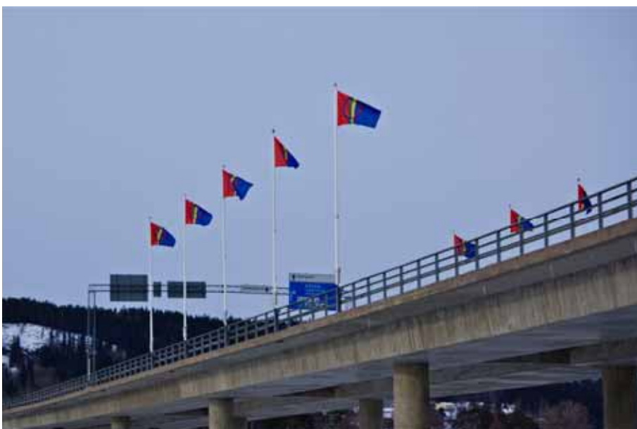
Det var inte bara Rådhuset som flaggade. På Frösöbron vajade dessa vackra sameflaggor i vinden.

Så tog jag en sväng mot Frösöbron och där vajade ytterligare ett antal Sameflaggor. Ja, det blev även ett foto på dessa.