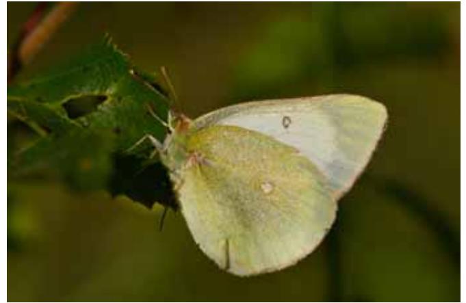
Naturligtvis har jag även denna sommar fotat en hel del fjärilar. Här en Svavelgul höfjäril.