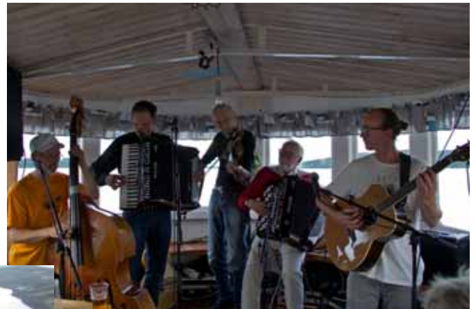
Så var det dags för en musiktur med Lindkvistarna ombord på Ångaren Östersund.