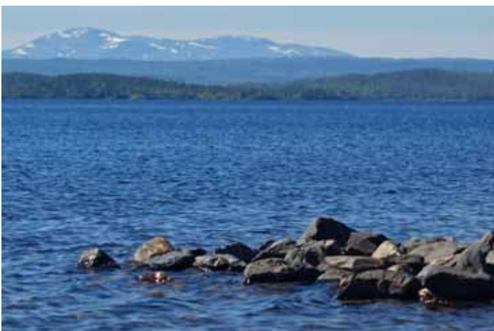
Slutligen en bild från Gärdesjön där man ser Åreskuttans baksida i bildens bakkant.