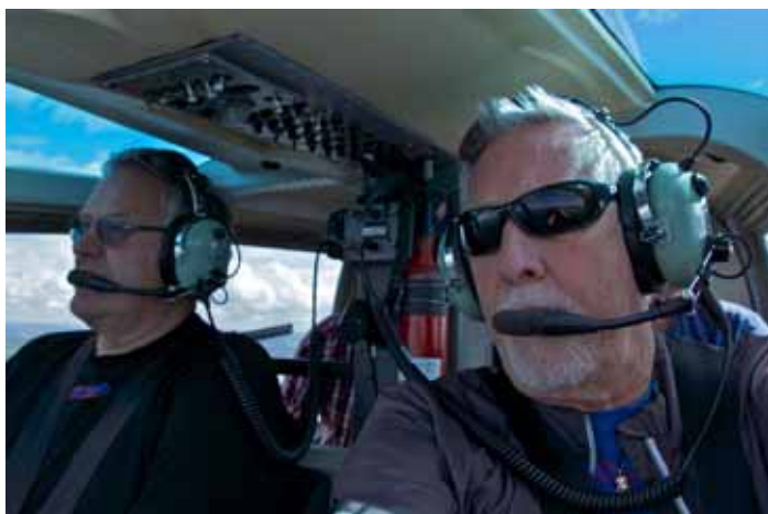
En selfie under en av sommarens helikopterturer

Många har klagat på att det har varit så regnigt, kallt och blåsigt. Han tycker att sommarvädret har varit helt ok. Detta syns även på hans bilder, finväder för det mesta.