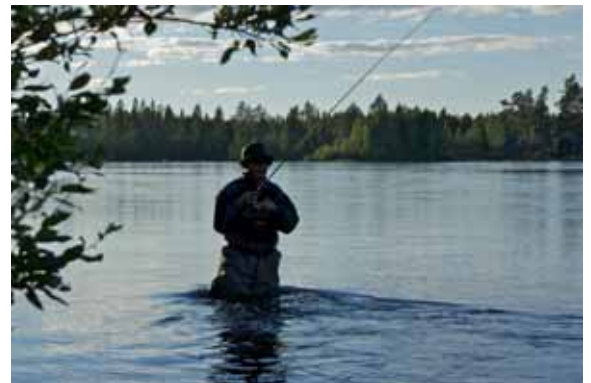
Så fick jag möjlighet att fota en av klubbens fiskande fotografer i full aktivitet i Kvittsleströmmen.