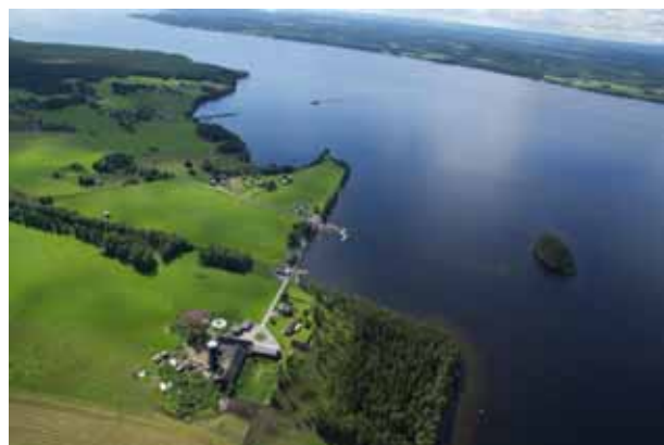
En översiktbild på Tivars gård på Norderön.