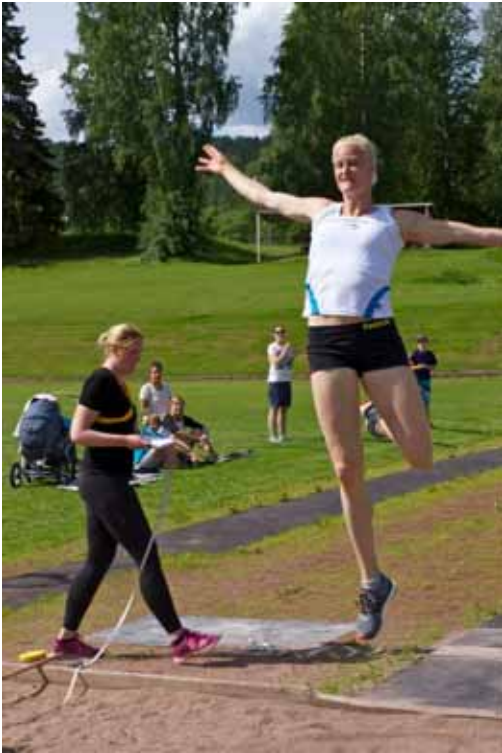
Även Carolina Clüft visade fortsatt spänst i detta längdhopp.