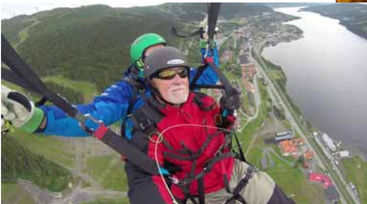
Här har jag tagit en selfie med en liten handhållen kamera på en lång stång. Detta vid min tandemflygning i skärmflygning i Åre. En mycket trevlig upplevelse.