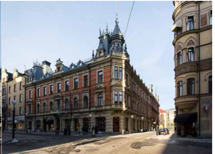
Blombergska huset byggt 1893