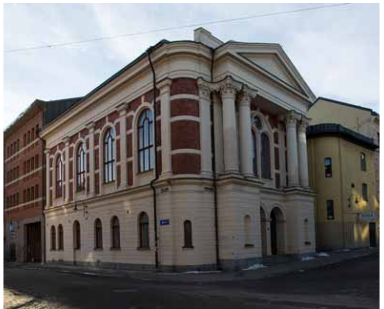
Metodistkyrkan (1892) . Stilen är blandning av italiensk och nordeuropeisk renessans. Kyrkan anses vara en Sveriges märkligaste och vackraste i sitt slag.