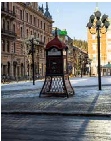
Utslagna av mobiltelefoner och E-post.