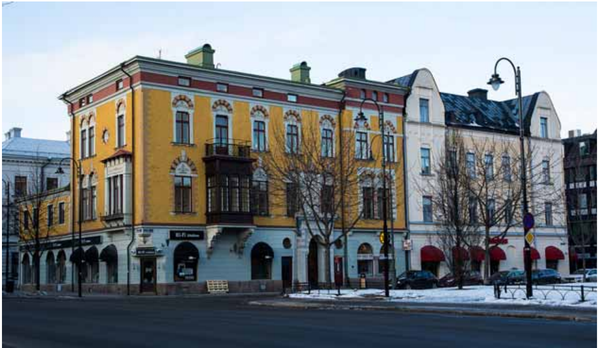
Det gula huset Wikströmska Huset (1892) är riktigt originellt och uppfört i en sorts spansk-morisk stil. Huset var ursprungligen en enfamiljsbostad med paradvåningen en trappa upp.