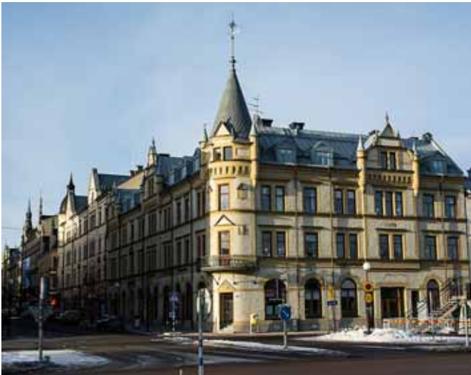
Ännu en bild på det Casselska huset

Det högra huset, Gamla tullhuset, är Stenstaden äldsta hus byggt 1855-57. Stommen av sten överlevde branden år 1888, inredningen fick man restaurera. Huset byggdes på med en våning år 1922. Till vänster ser vi det Casselska huset byggt 1894-95