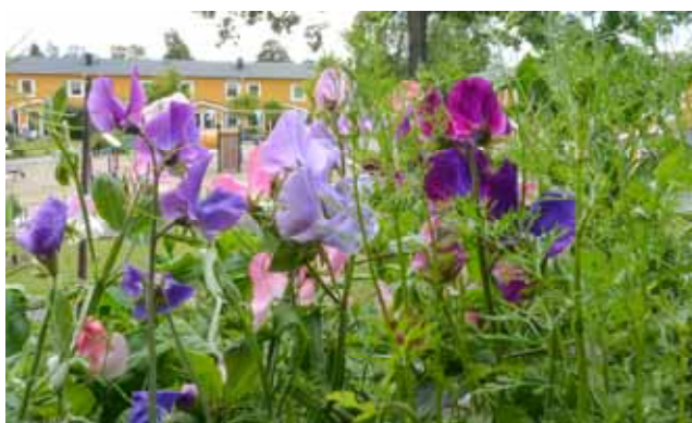
332. UTANFÖR MITT FÖNSTER (173/366) Genom fönstret i sovrummet ser jag blomlådorna på balkongen.