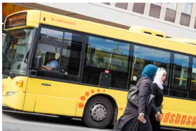
261. SER INTE SKOGEN FÖR ALLA TRÄD (209/366) Vi kan resa och träffa människor från olika kulturer i ett vackert och spännande Sverige. Ibland missar vi det som finns nära.