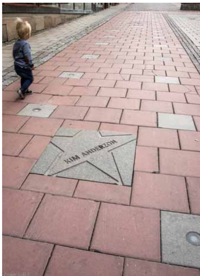
337. WALK ON FAME (213/366) En promenad på Stjärntorget i Östersund.