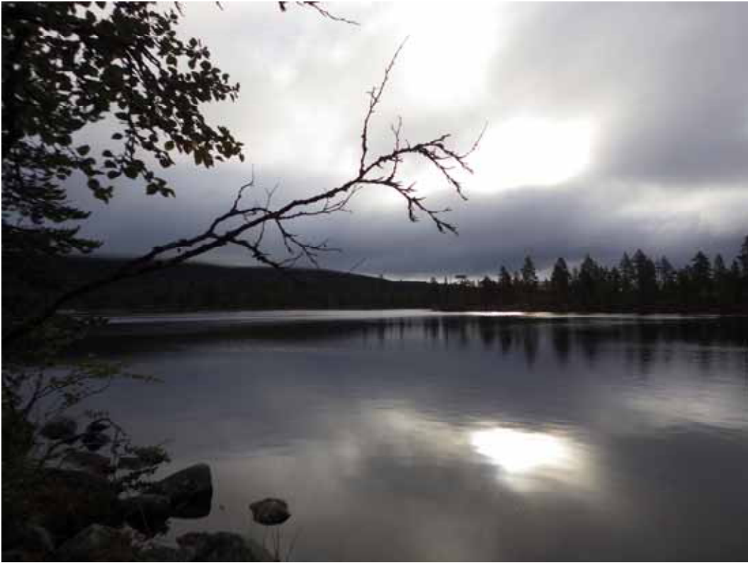
Text och foto: Pär Leijonhufvud