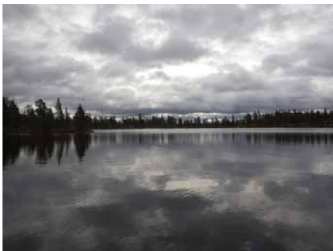
Text och foto: Pär Leijonhufvud